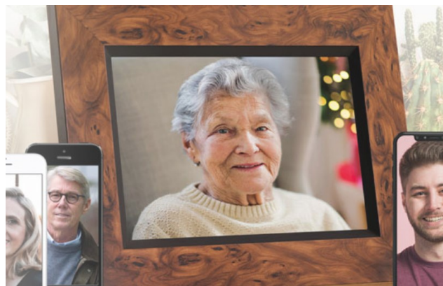
* Foto Memory lane

Het Memory Lane ZorgScherm is een touchscreen dat door ouderen kan worden bediend zonder enige technische kennis. Het ziet eruit als een mooie digitale fotolijst, maar het biedt talloze slimme functies gericht op zorg en ontspanning. Steek de stekker in het stopcontact en maak verbinding met wifi en de app op je mobiel. Meer hoeft je niet te doen. Geen wifi? Geen probleem. Het ZorgScherm werkt ook op een simkaart die standaard in het apparaat is opgenomen.