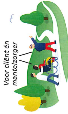
Voor cliënt én mantelzorg