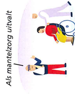
Als mantelzorg uitvalt